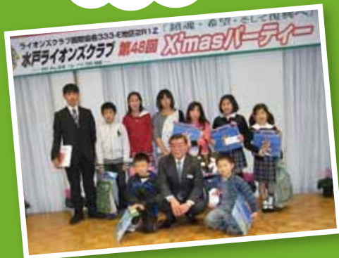
みんなそれぞれの クリスマスプレゼント!!