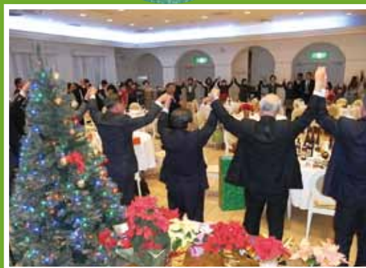
今年も元気に「また会う日まで」