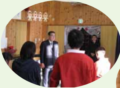
子どもの感謝の言葉を 受け取る本多会長