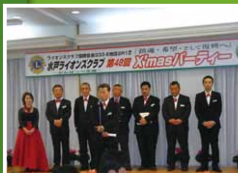
金子計画・情報委員長のご挨拶

昨年の3.11未曾有の東日本大震災で亡くなられた方、大変な被害を受けた方たちに対して黙祷、そして「鎮魂・希望・復興」の思いを込めて、琴、尺八で始まった今年のクリスマス例会。皆それぞれ大変な一年を過ごしてきました。ものまね芸人ショーを見たりしながら通年のクリスマス例会とは、また違った意味合いのもと、家族、メンバー、来賓の方々、皆んなで楽しいひとときを過ごしました。 L 佐藤(隆)