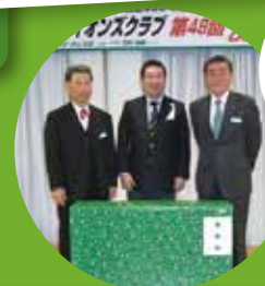
会長賞 テレビ当たりました!!